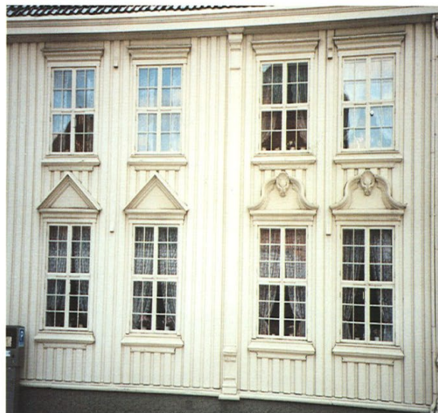
TREHUS 2: 50%