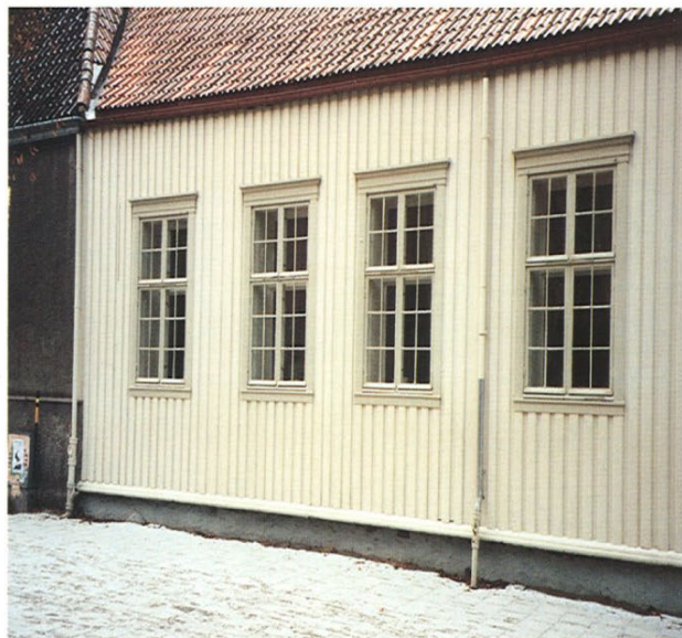
TREHUS 1: 0%