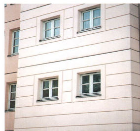
FASADE 2 – anbefalt presentsats 25%