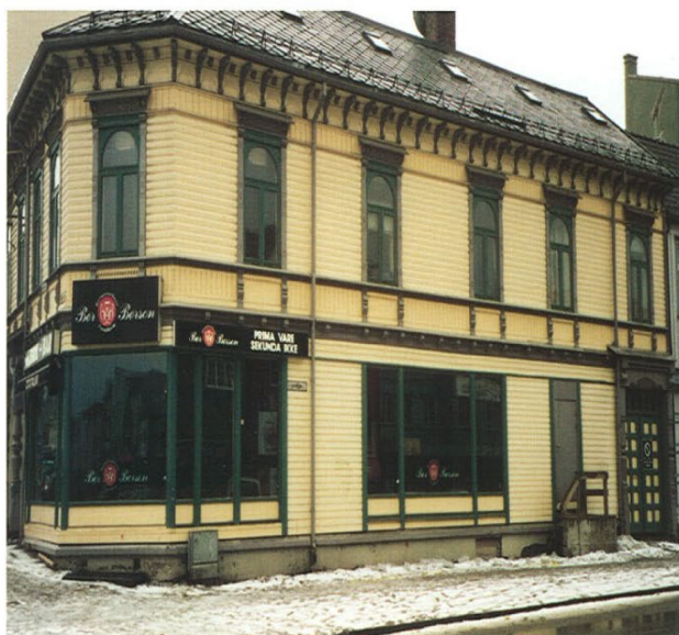
TREHUS 3: 100%