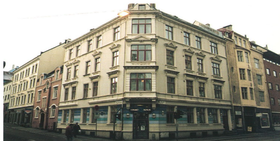
FASADE 10 – anbefalt presentsats 300%